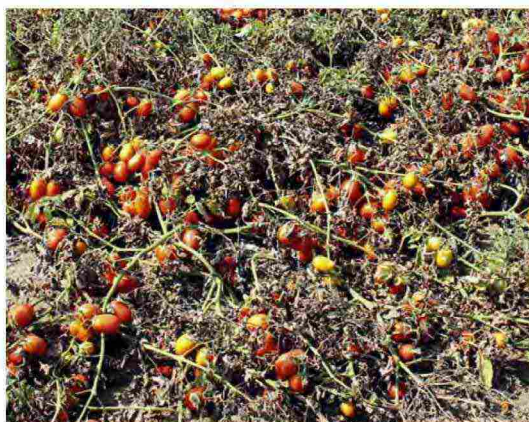
Danni da ragnetto rosso su pomodoro

Sembra vi sia un indizio positivo, però: tali resistenze non sono persistenti, ma possono essere «perse» dalle popolazioni, a seguito del non incontro della sostanza attiva per periodi più o meno lunghi.