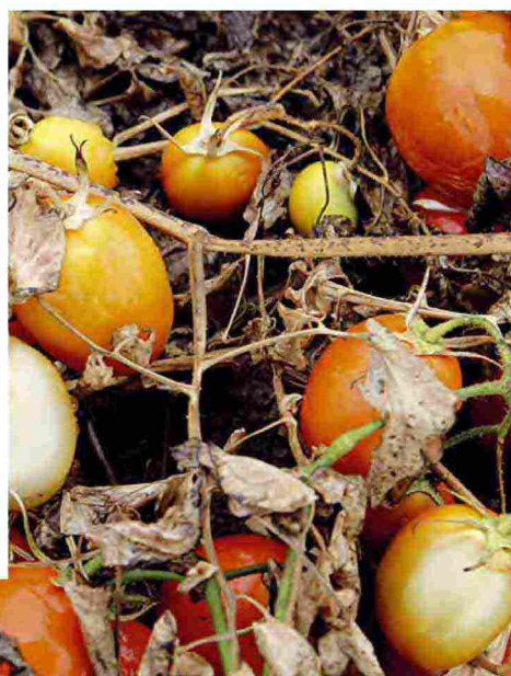
Danni da ragnetto su pomodoro in areale ad alto rischio

Intensità degli attacchi: verde = generalmente non richiedono interventi acaricidi. Quando il problema si presenta viene risolto egregiamente; giallo = in alcune annate il problema può essere di difficile contenimento; rosso = il problema si presenta praticamente tutti gli anni. Tali aree presentano le maggiori difficoltà di contenimento spesso con compromissione delle rese colturali.